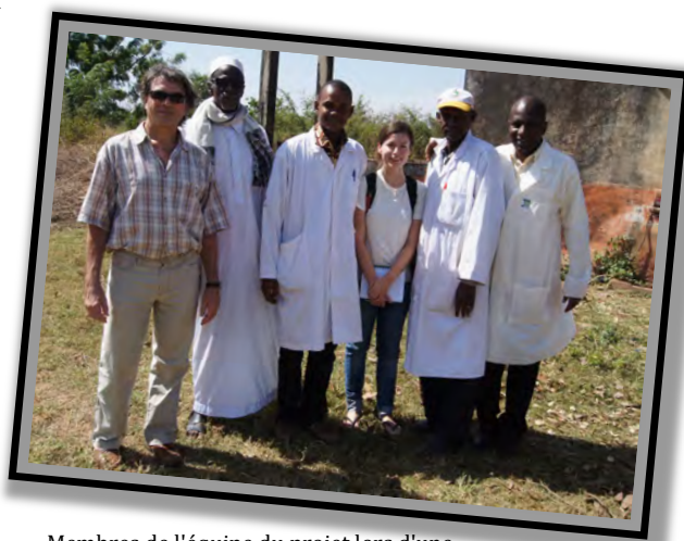
Membres de l'équipe du projet lors d'une visite de l'IER au Mali.